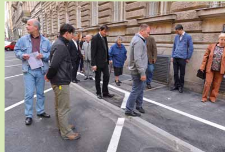
Helyszíni bejárás a Kertész utcában