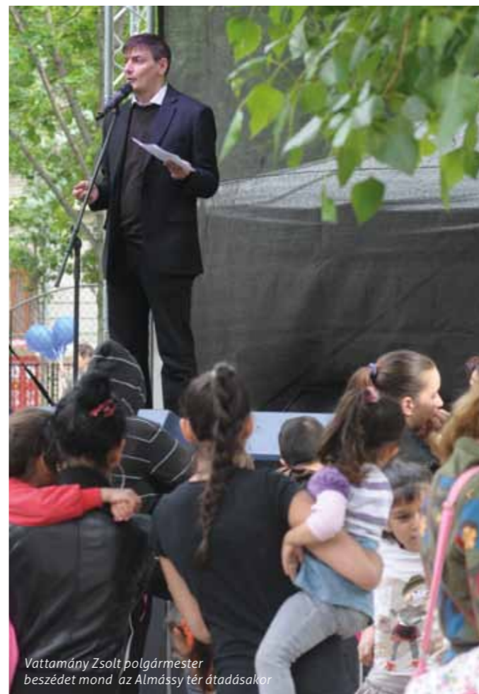
Vattamány Zsolt polgármester beszédet mond az Almássy tér átadásakor

programját, több ezer levelet kaptam, melyek nagy részében szerepelt az Almássy tér felújítása. Igyekezünk úgy átépíteni a területet, hogy mindenki megtalálja benne a saját boldogságát: a játszótér birtokba vevő gyermekek és szülei, a parkban pihenő nyugdíjasok, a társasági életre vágyók és kutyafuttatót látogatók egyaránt. Büszke vagyok az erzsébetvárosi