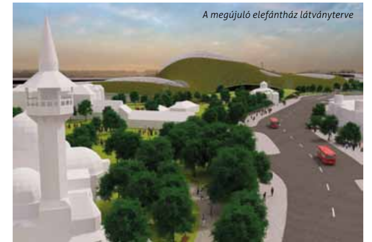
A megújuló elefántház látványterve

A megállapodásnak köszönhetően az elmúlt három évben több mint kilencezer kerületi – óvodások, általános és középiskolás csoportok, illetve erzsébetvárosi lakóhellyel rendelkező gyermekek – tett látogatást az állatkertben. Kedvezményben részesültek továbbá a nyugdíjasok, valamint az Ezüstévek-kártyával rendelkező, 60 év feletti, nagycsaládos, illetve gyermekeiket egyedül nevelő erzsébetvárosi polgárok is.