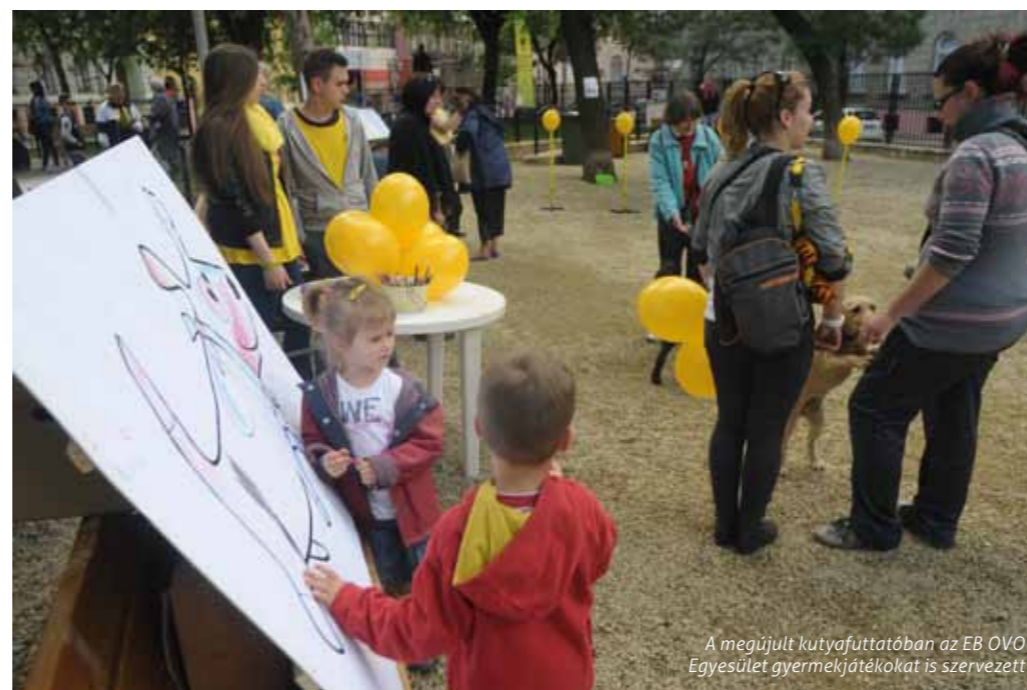
A megújult kutyafuttatóban az EB OVO Egyesület gyermekjátékokat is szervezett