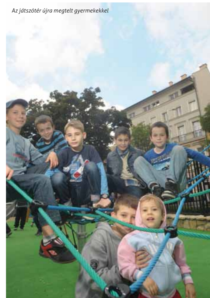
Az játszótér újra megtelt gyermekekkel

polgárookra, hogy most itt állhatunk együtt, beteljesítve egy közös álmunkat. Kérem, hogy vigyázzunk a tér állapotára még akkor is, ha az erzsébetvárosiak kérésének megfelelően gondoskodni fogunk az őrzéséről, hiszen közös felelősségünk, hogy a terület még sokáig szolgálja az összes itteni polgár kényelmét.”