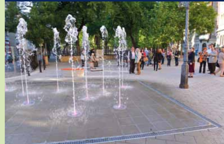
A modern utcabútorok kényelmesebbé és esztétikusabbá teszik a teret